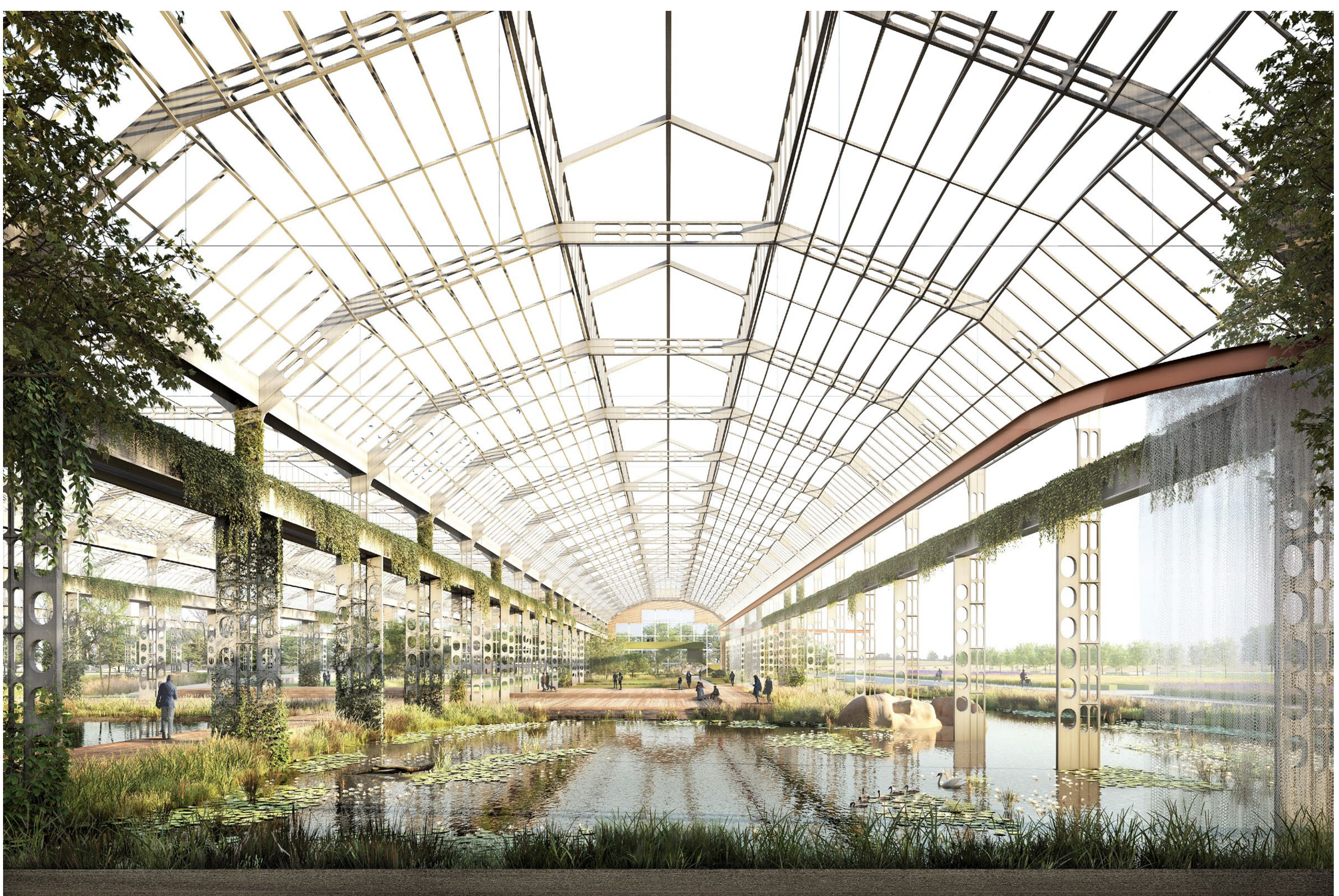
Magnifica fabbrica, Palazzo di Cristallo.