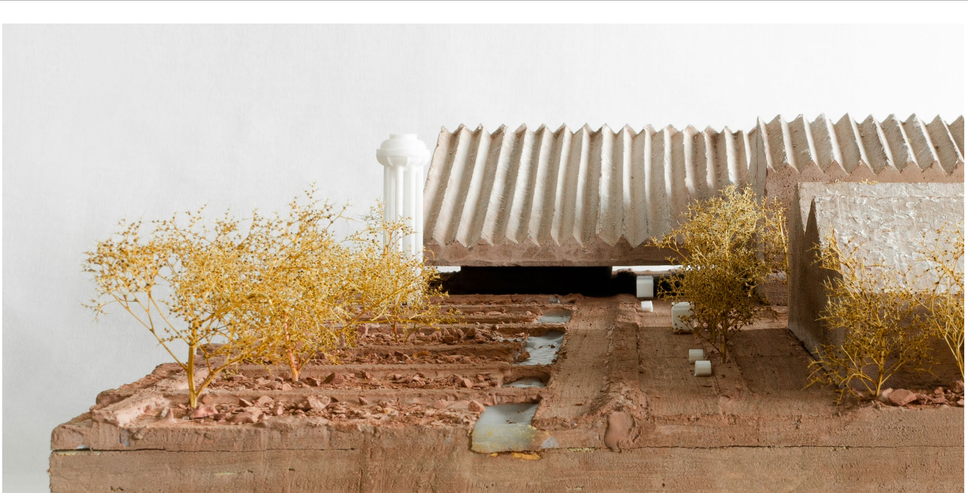
Magnifica fabbrica. Modello in cemento rosso. Vista da via Caduti di Marcinelle